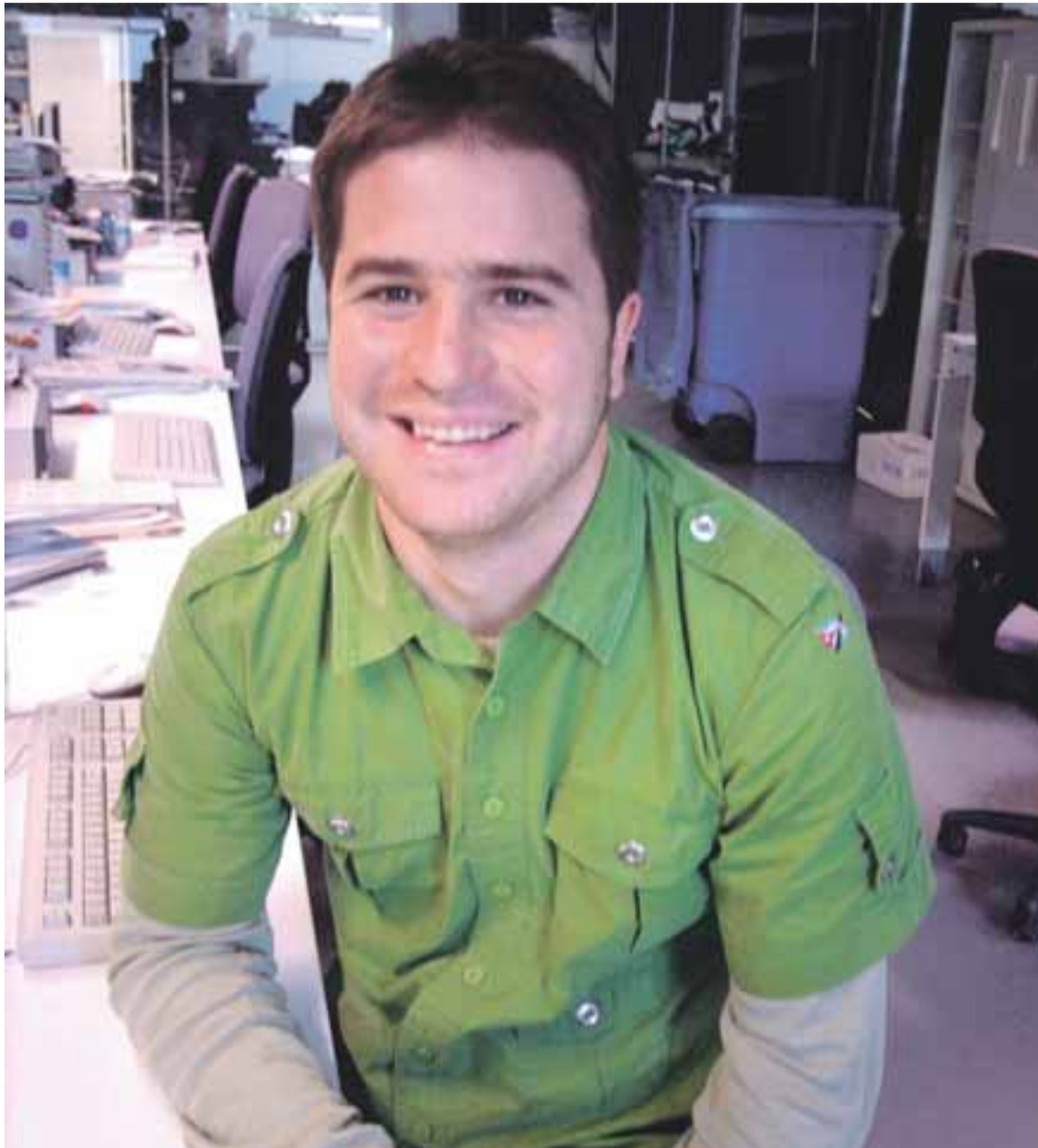
Imaz piensa que es importantísimo aprender idiomas para comunicarse con otros y descubrir nuevas culturas.

bajo, porque las relaciones entre el País Vasco francés y Gipuzkoa son bastante habituales. En Donostia siempre se organizan conferencias, encuentros y ruedas de prensa de personas francófonas que ahora puedo seguir con más naturalidad. También lo he utilizado en las visitas que he hecho en Francia y en algún viaje al Magreb.