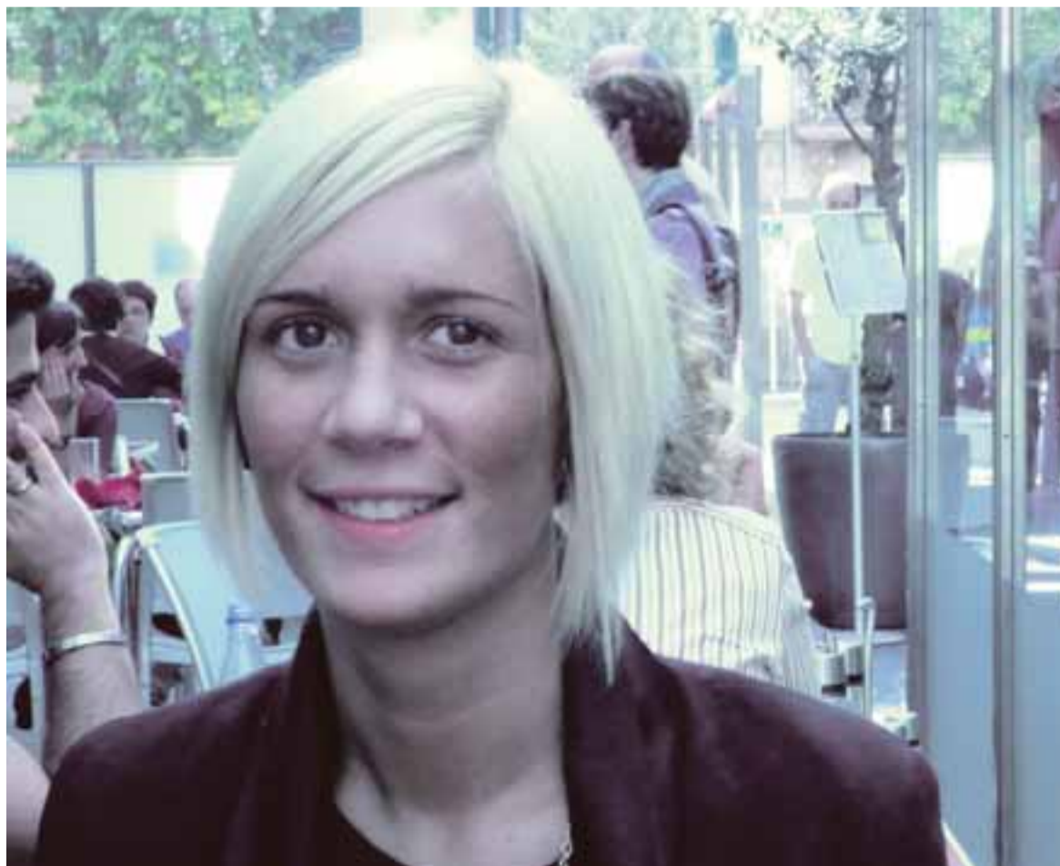
Elgarresta afirma que es una gran satisfacción poder hablar con cualquier persona del mundo.

Sí. He estudiado en Madrid y allí es donde me he dado cuenta de que es necesario, por lo menos, saber