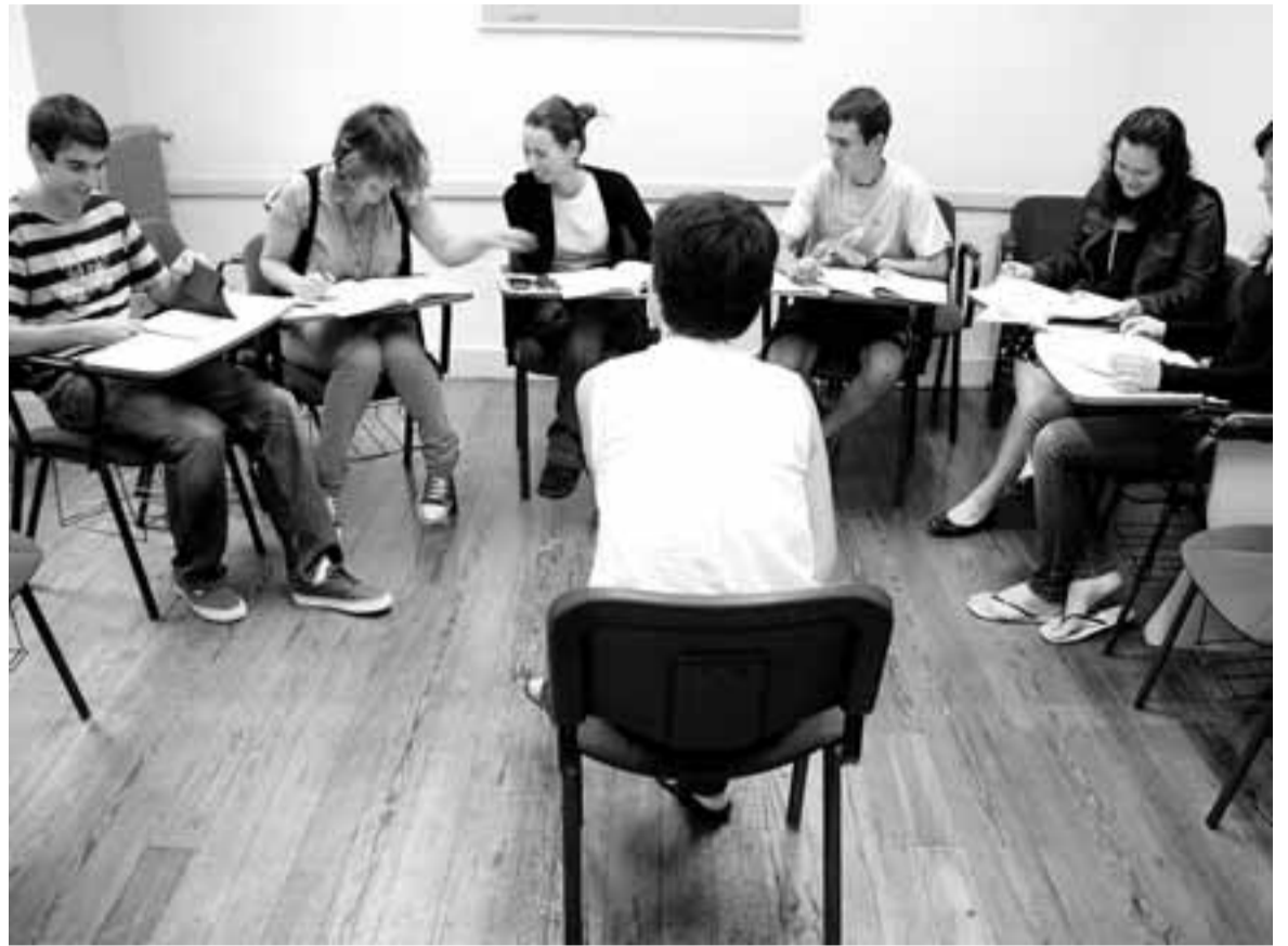
Alumnos de la academia de idiomas recibiendo una clase de inglés.

MULTITUD DE PROCEDENCIAS Profesores de calidad, algunos nativos